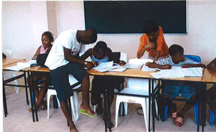
Hier wordt gewerkt

We zien regelmatig goede resultaten van deze groep kinderen. Hun schoolwerk verbetert gigantisch en ze krijgen er ook meer plezier in omdat ze niet lager achterop zijn. Hun zelfvertrouwen neemt toe. Het is motiverend om te zien dat sommige ouders nu hun kinderen naar onze huiswerkklassen brengen om ze de kansen te bieden die ze zelf nooit hebben gehad.