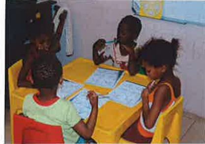
geconcentreerd werken in de klas

Door een samenhangende aanpak worden de kleuters op de lagere school voorbereid. Zo leren ze wat het is om in een rij te staan, Engels te spreken, hun handen te wassen voor het eten en gebruik te maken van het toilet. Er wordt veel aan gedaan om de kinderen te motiveren en hen zelfvertrouwen te geven. Dit laatste valt niet altijd mee. Immers de jeugd ziet om zich heen zoveel ouderen die zich mislukt voelen en van wie geen enkele stimulans uitgaat. Deze kinderen missen vaak het goede voorbeeld en de liefde van een vader en moeder. Hoe kunnen we van hen verwachten dat ze later liefde geven aan hun kinderen, wanneer ze die zelf in hun eigen jeugd niet hebben ervaren. Dit is dan ook een van de belangrijkste functies van de leidsters van onze kleuterschool. Het bieden van liefde en aandacht aan onze kleuters.