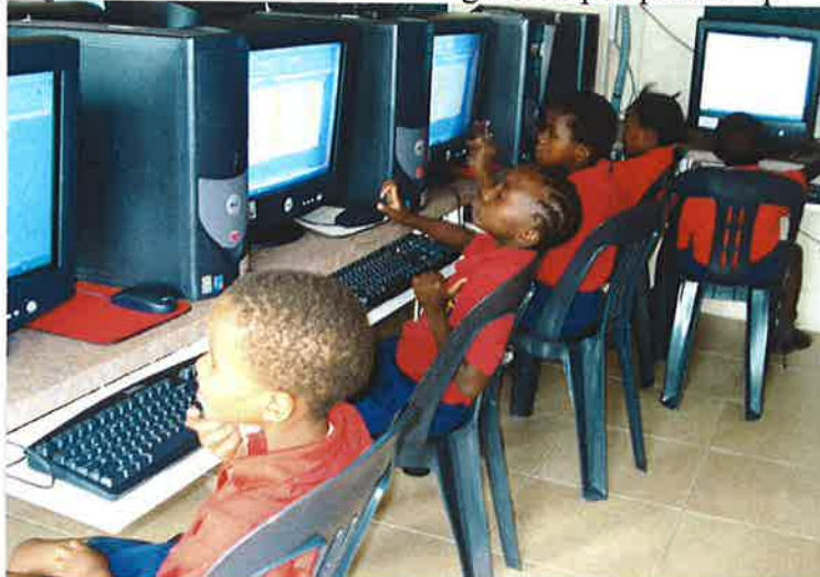
Een groep kinderen van de "Community Hope School" achter de knoppen.

Geen enkele school in onze wijk biedt deze faciliteit aan en wanneer wij ermee zouden stoppen, zouden we deze jeugd minder kansen bieden om uit de neerwaartse spiraal van werkeloosheid en armoede te breken. Mede door deze klassen krijgen de scholieren een goede kans om verder te komen in het leven. Het geeft ze perspectief op werk en/of doorleren.