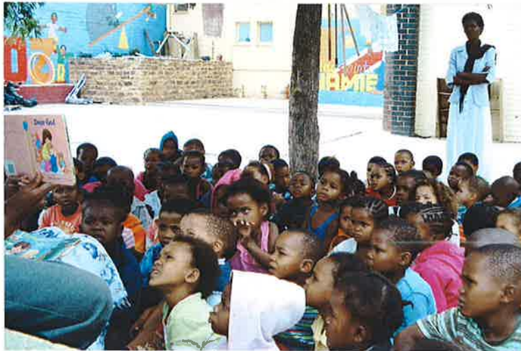
juf heeft alle aandacht

Door een samenhangende aanpak worden de kleuters op de lagere school voorbereid. Zo leren ze wat het is om in een rij te staan, Engels te spreken, hun handen te wassen voor het eten en gebruik te maken van het toilet. Er wordt veel aan gedaan om de kinderen te motiveren en hen zelfvertrouwen te geven. Dit laatste valt niet altijd mee. Immers de jeugd ziet om zich heen zoveel ouderen die zich mislukt voelen en van wie geen enkele stimulans uitgaat. Deze kinderen missen vaak het goede voorbeeld en de liefde van een vader en moeder. Hoe kunnen we van hen verwachten dat ze later liefde geven aan hun kinderen, wanneer ze die zelf in hun eigen jeugd niet hebben ervaren. Dit is dan ook een van de belangrijkste functies van de leidsters van onze kleuterschool. Het bieden van liefde en aandacht aan onze kleuters.