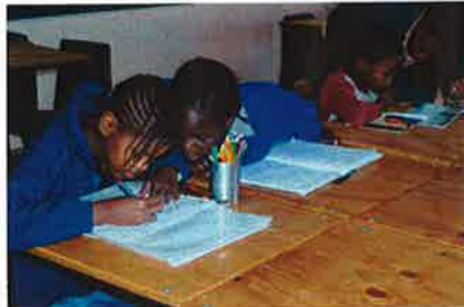
Mijn vriendinnetje weet het vast beter...