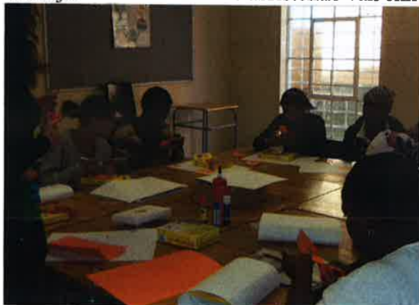
Enkele tienermoeders tijdens de les.

Nieuw in 2011 is ook de cursus voor alleenstaande tienermoeders. Helaas zijn er in de wijk nogal wat alleenstaande jonge moeders. De meesten leven in een uitzichtloze situatie. Ze zien er verwaarloosd uit en hebben maar weinig kennis over het opvoeden van een kind. Er is twee maal een cursus van acht weken gegeven waarbij de jonge moeders onder meer les krijgen in basishygiëne, gezondheid en kinderopvoeding. Wanneer de moeders niet de basiskennis over opvoeding bezitten, krijgen hun kinderen ook onvoldoende bagage mee en zo komen ze niet uit de cirkel van ziekte en armoede. De jonge vrouwen waarderen de cursus erg en we hopen deze volgend jaar te kunnen voortzetten. Onze eigen staf leidt de cursus. We zijn dankbaar voor de assistentie van enkele gespecialiseerde vakkrachten uit Windhoek.