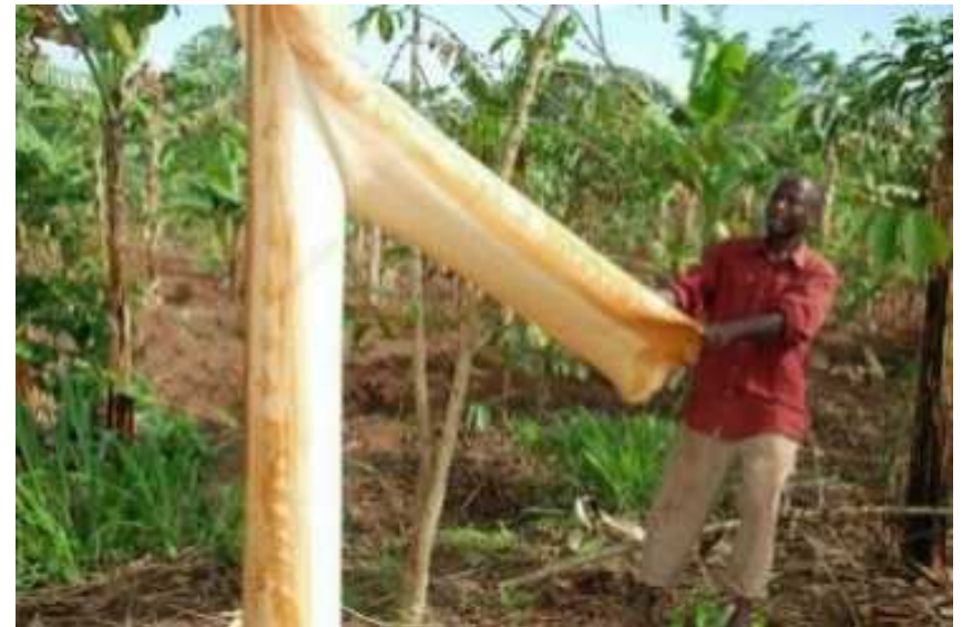
De schors van de Mutuba boom kan tot textiel worden verwerkt

Gezien het succes van eerdere projecten van MCAFS en het goed doordachte plan, ondersteunde Overal dit project met 6700 euro